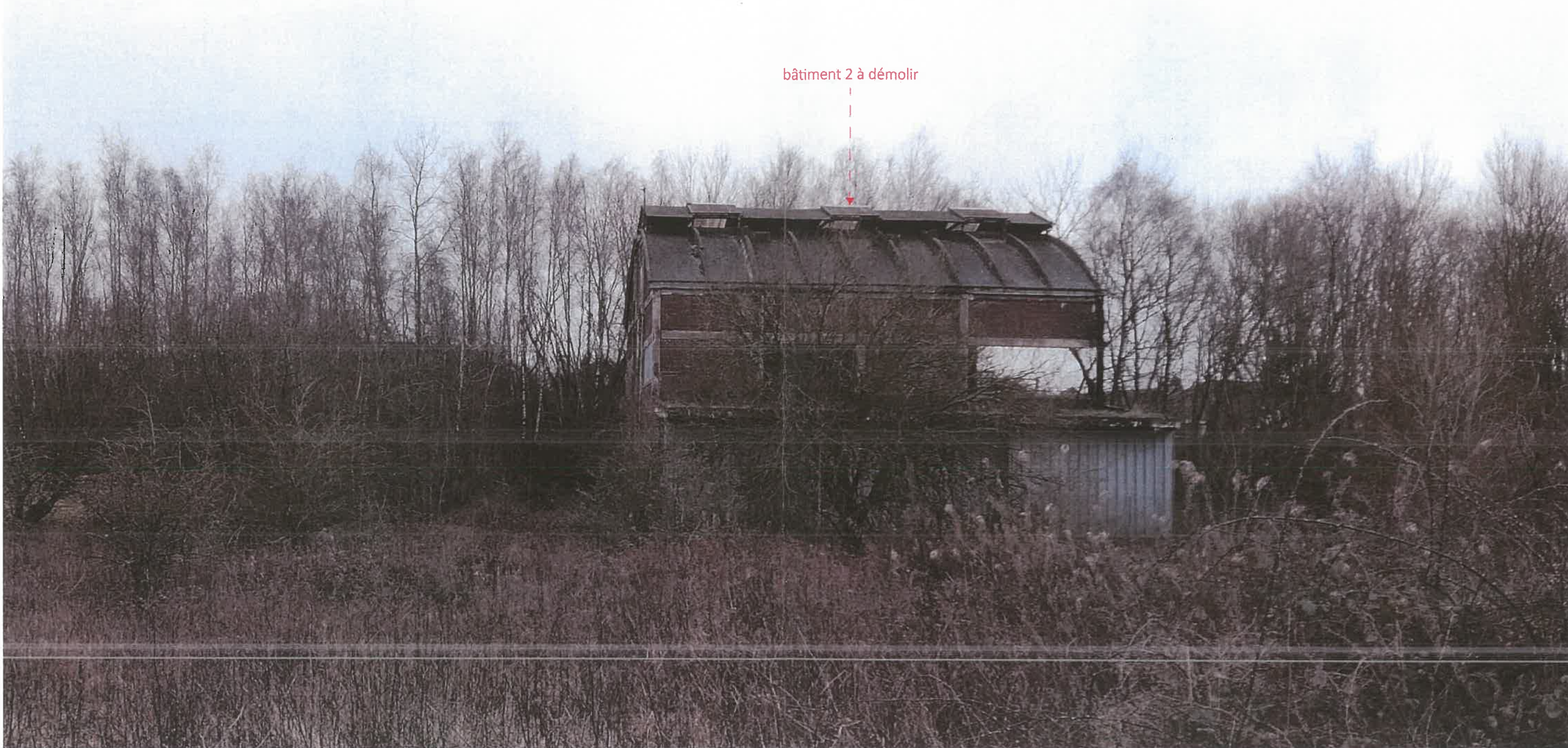
Point de vue n°5 - vue du bâtiment 2 à démolir